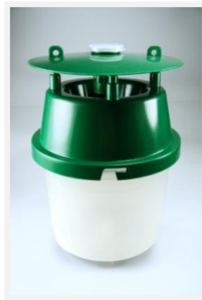
Foto B. - Pułapka Kominowa